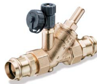
KEMPER Rückflussverhinderer mit fest integriertem Pressanschluss Viega Figur 195 31