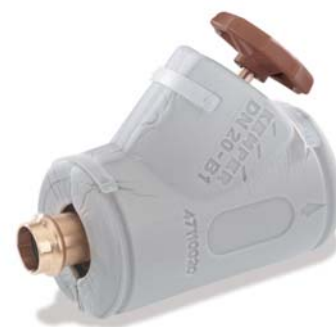
KEMPER Dämmschale universell für alle KEMPER Freistrom-Schrägsitzventile Figur 471 10