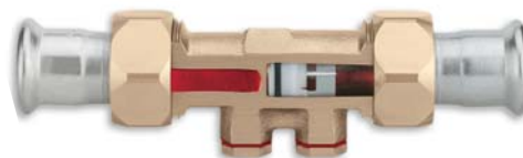
KEMPER Rückflussverhinderer (RV) zum Sichern Figur 158