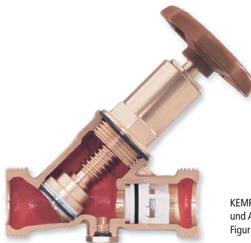
KEMPER Kombi-Rückflussverhinderer (KRV) zum Sichern und Absperren mit wartungsfreier Lippendichtung Figur 145

KEMPER Sicherungsarmaturen zum Schutz des Trinkwassers nach DIN EN 1717. Zuverlässige, sichere und technisch ausgereifte Lösungen. Komplett aus Rotguss, leichtgängig und weichdichtend. Mit stabiler Sicherungsfunktion für langanhaltende Funktionssicherheit.