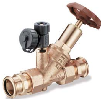
KEMPER Kombi-Rückflussverhinderer mit fest integriertem Pressanschluss mapress Figur 193 23