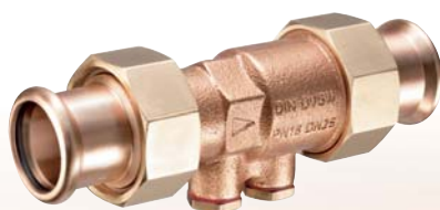
Figur 158 36

KEMPER Durchgangs-Rückflussverhinderer mit SANHA®-Pressverschraubung , Öffnungsdruck nur \geq 10 mbar, komplett aus Rotguss, beständig gegen aggressives Wasser, totraumfrei, nach DIN 3269-1, mit DIN-/DVGW- und Schallschutzzulassung, beidseitig mit Rotguss-Pressverschraubungen für Cu-Rohr System SANHA® und NiroSan®.