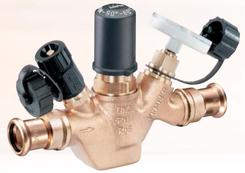
Figur 131 35 und Figur 546 02

KEMPER Systemventil mit SANHA®-Systemanschluss als Stockwerks-Regulierventile , wahlweise als UP-Regulierventil oder mit Betätigungsgriff. Automatische Feinregulierventile für den hydraulischen Abgleich von Stockwerksverteilungsleitungen mit k_v\text{-min} \geq 0.05 zur Einregulierung von Zirkulationssystemen im Bereich der Stockwerkszirkulation. Komplett aus Rotguss, beständig gegen aggressives Wasser, beidseitig mit festem Rotguss-Pressanschluss für Cu-Rohr System SANHA® und NiroSan®, DN 15.