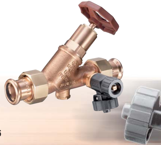
Figur 145 35/36

KEMPER Durchgangs-Rückflussverhinderer mit SANHA®-Pressverschraubung , Öffnungsdruck nur \geq 10 mbar, komplett aus Rotguss, beständig gegen aggressives Wasser, totraumfrei, nach DIN 3269-1, mit DIN-/DVGW- und Schallschutzzulassung, beidseitig mit Rotguss-Pressverschraubungen für Cu-Rohr System SANHA® und NiroSan®.