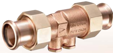
Figur 158 36

KEMPER Durchgangs-Rückflussverhinderer mit SANHA®-Pressverschraubung , Öffnungsdruck nur \geq 10 mbar, komplett aus Rotguss, beständig gegen aggressives Wasser, totraumfrei, nach DIN 3269-1, mit DIN-/DVGW- und Schallschutzzulassung, beidseitig mit Rotguss-Pressverschraubungen für Cu-Rohr System SANHA® und NiroSan®.